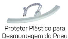
Protetor Plástico para Desmontagem do Pneu