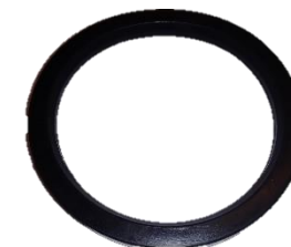
BORRACHA DO COPO