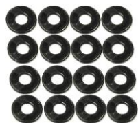
0400-2176-99 ARRUELA LISA ZINCADA PRETA