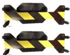
7109-1165-99 SUPORTES FIXADORES