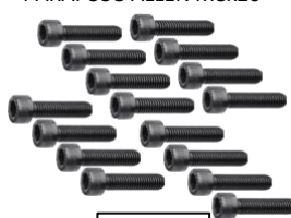
0686-2130-99 PARAFUSO ALLEN M8x20