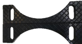
7120-2627-92 CALÇO DE BORRACHA