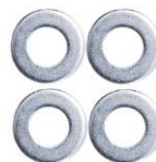
0400-2022-99 ARRUELA LISA ZINCADA 13x24