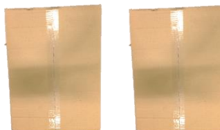
PGM-025 PRATO GIRATÓRIO