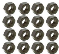
0409-2060-99 PORCA SEXTAVADA PRETA M8