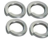
0604-9001-99 ARRUELA DE PRESSÃO ZINCADA