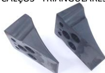
S/N CALÇOS TRIANGULARES