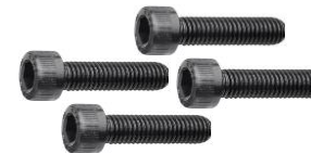
0686-2153-99 PARAFUSO ALLEN M12x35