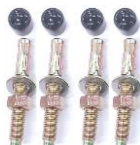
S/N PARAFUSOS CHUMBADORES