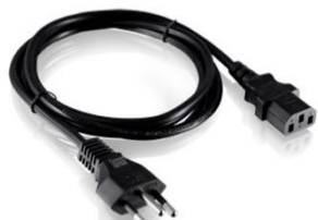
6001-9012-98 CABO ALIMENTAÇÃO 6M