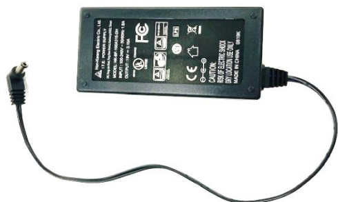
FONTE DA CÂMERA