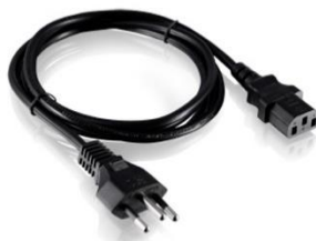
CABO ALIMENTAÇÃO 1,5M