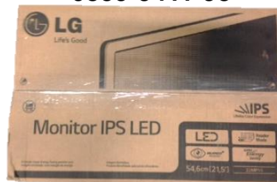
MONITOR 21,5" 0859-9411-98