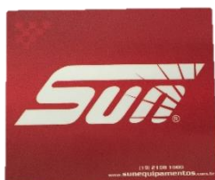
PAD MOUSE SUN 0552-0904-99