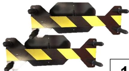
SUPORTE FIXADOR 7109-1165-99