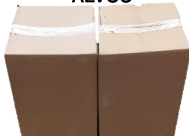
KIT FIXADOR COM ALVOS