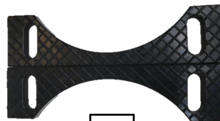
CALÇO DE BORRACHA 7120-2627-92