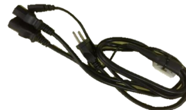
CABO ALIMENTAÇÃO ESPECIAL