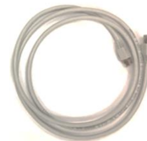
CABO COMUNICAÇÃO ETHERNET EAW0291V01AT