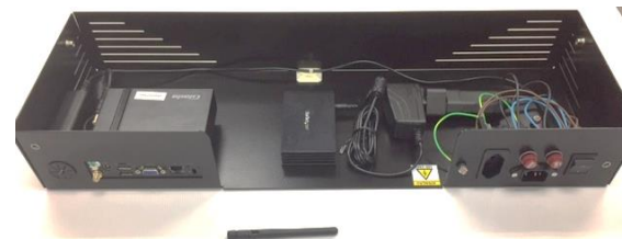
GAVETA DE INFORMÁTICA