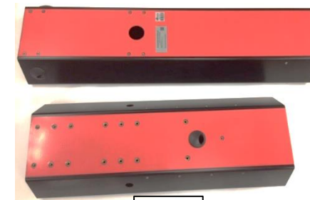
KIT DE COLUNAS