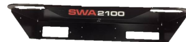
SUPORTE DO TECLADO