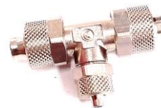
"T" DE CONEXÃO