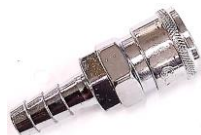
BICO ENGATE RÁPIDO