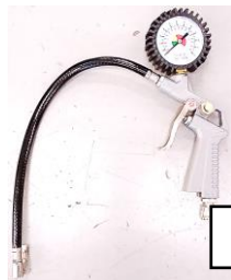
INFLATOR C/ MANGUEIRA