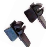
PROTETOR DE ARO