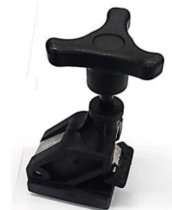
TRAVA PRESSIONADORA EAA0358G85A