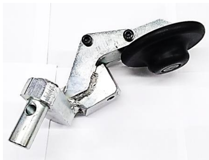
FERRAMENTA COM DISCO EAA0362G82A