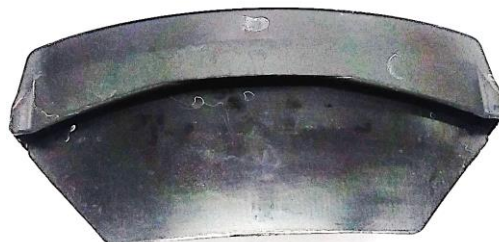
PROTECTOR PLASTICO DO DESTALONADOR EAA0304G15A