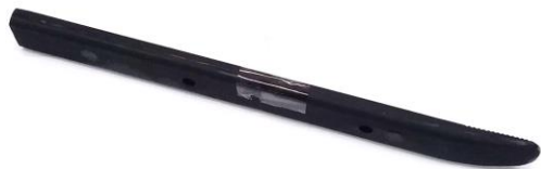
CAPA DE PROTEÇÃO DA ALAVANCA EAA0247G04A