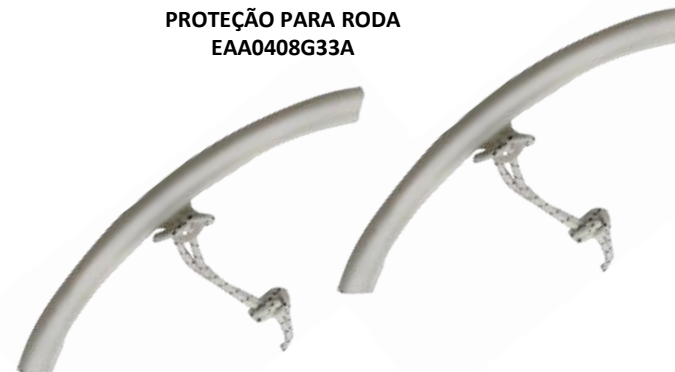
CAPA PLÁSTICA DE PROTEÇÃO PARA RODA EAA0408G33A