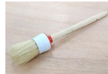
PINCEL DE LIMPEZA