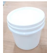
BALDE PLÁSTICO COM TAMPA