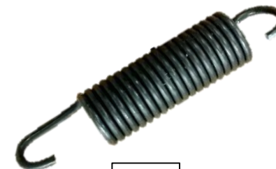
MOLA (no equipamento)