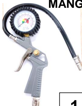
INFLATOR COM MANGUEIRA