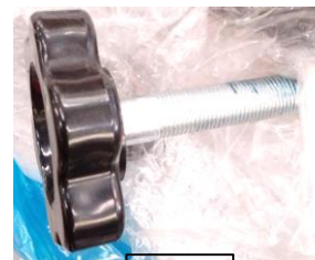
MANÍPULO DO BRAÇO (no equipamento)