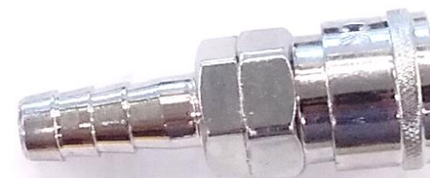
BICO ENGATE RÁPIDO