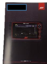
MANUAL DE OPERAÇÕES