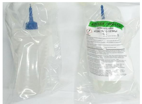
02 GARRAFAS DE COLETA DE ÓLEO