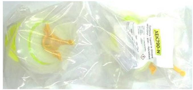
02 RESERVATÓRIOS DE ÓLEO