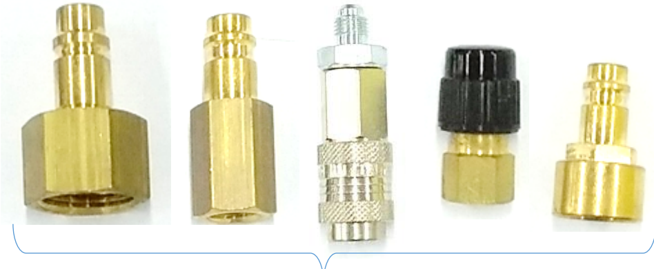
05 CONEXÕES A GÁS