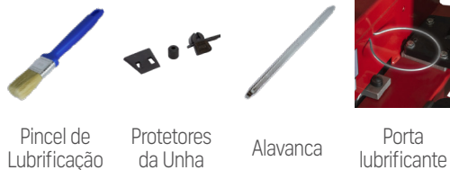
Pincel de Lubrificação