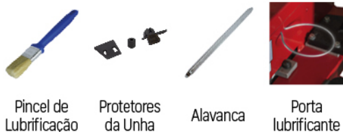
Pincel de Lubrificação