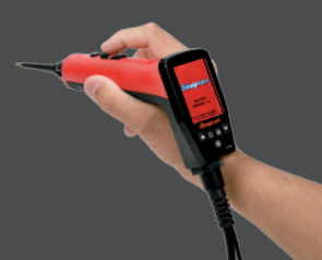
Portátil e Versátil, com cabos de 7 metros

5 cores de telas diferentes para facilitar o trabalho